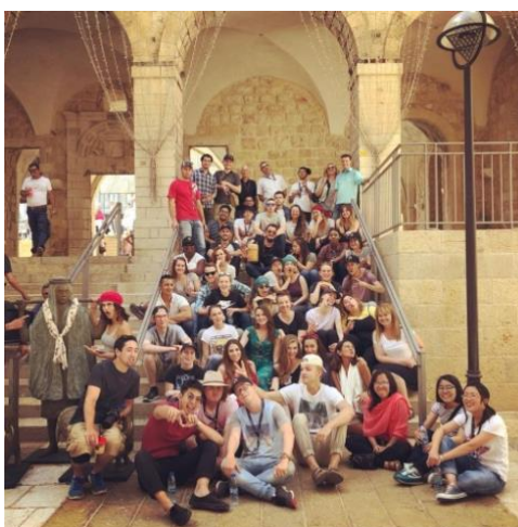
ヤングアダルトツアーの皆さん

つい先ほど、若者ツアーを終えたところです。50人の若者が、異なる6つの大陸、15か国から集まりました。