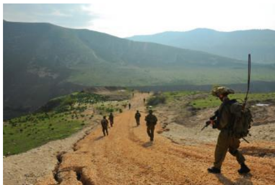
IDF、予告なしの軍事演習をゴラン高原で開始