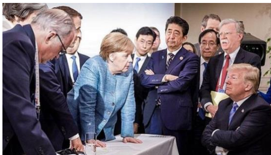
対立するメルケル独首相とトランプ米大統領

その中でもセバスチャン・クルツは最年少です。非常に興味深い事に、彼は国内のムスリム移民について非常に危惧していて、先週オーストリア国内の9カ所のモスクを閉鎖し、そのイマムを全員追放しました。それらのモスクのうち一つはトルコのもので、スルタン・エルドアンは、それを行ったオーストリアに対して激怒しています。ただ、イスラムの拡大と、過激派イスラムによるテロに対する反乱の種は、オーストリアだけでなくヨーロッパ中に蒔かれているのが分かります。ドイツは未だに…何と言って良いのかも分かりません。知恵の遅れた政権としか言いようがありませんが、彼らは、自分たちの国が崩壊して行くのを目にしなが、それを修復する代わりに、どんどん悪化させています。そしてまさにそのためにG7を終え、数時間前にシンガポールに到着したトランプ大統領は、誰が“ボス”であるかを、ドイツに見せつけたのです。