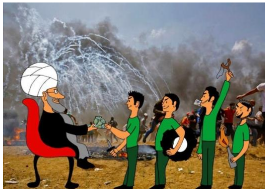
イランからテロ報奨金をもらっている！

別の言い方をすれば、彼らはイランから何百万ドルという資金を受け取り、そして一人につき 250 ドルずつ払っているのです。ちなみにこれはガザの人たちにとって、月給よりも多い金額です。しかしイランがガザの人たちを扇動するために、これほどの賄賂をつかったにもかかわらず、現れたのはほんの少人数だけでした。みな、これにはウンザリしているのです。ハマスは、イランとヒズボラと毎日連絡を取り合っていることを認めました。彼らはイランの代理になっています。ただはっきりとお伝えしておきたいのは、今の時点で、我々はハマスを滅ぼすことは望んでいません。彼らが、彼らの民を支配する方が、我々には益となるのです。イスラエルは 200 万人のムスリムたちが住むガザに入って、あの地域を再び支配することは何としてでも避けたいのです。ですから一方では私たちは、彼らの軍事社会基盤施設を破壊したいですが、他方では彼らが自分たちの民を支配するために、それらをあちらに残しておきたいのです。今の時点では、これより良い選択肢はないのです。基本的には以上です。