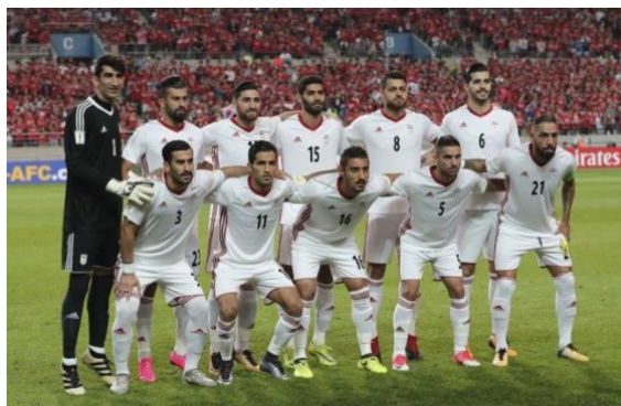
サッカーのイランチーム

イランの人たちは、ほぼすべての町でデモを行なっています。イラン経済はまさに崩壊しており、彼らのサッカーチームまでもが今日受け取ったニュースは、ロシアで行われるワールドカップで、ナイキが、彼らが履くシューズを提供も販売もしないというものでした。