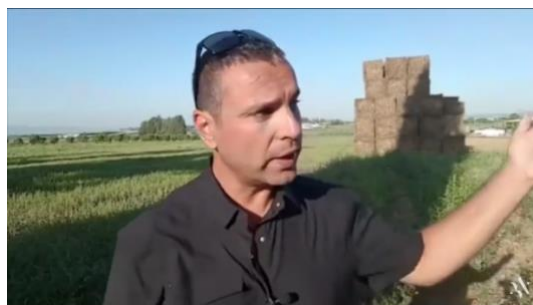
エズレル平原の美しい風景

..... ハルマゲドンの谷、エズレル平原よりこんにちは。ここは、地元の人が経営する農場の隣で、今回、このライブをするために使わせていただきました。この近くで、息子の乗馬のレッスンがあって、予定の時間までに家に帰れないのと、自宅には子どもたちがたくさん来ていてにぎやかなので、この美しい背景を皆さんに見ていただくことにしました。