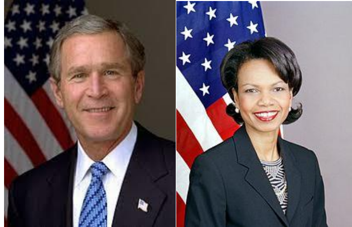
ブッシュ元米大統領（左）とライス元米 국무長官（右）