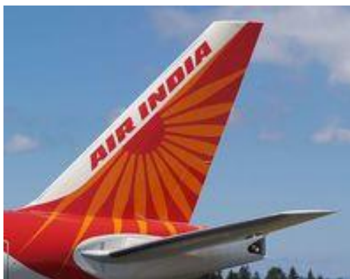
インド航空の尾翼

もう一つ、興味深いニュースは、インド航空の、ニューデリーからはるばるテルアビブまでの史上初のフライトが、数時間前にニューデリーを離陸しました。