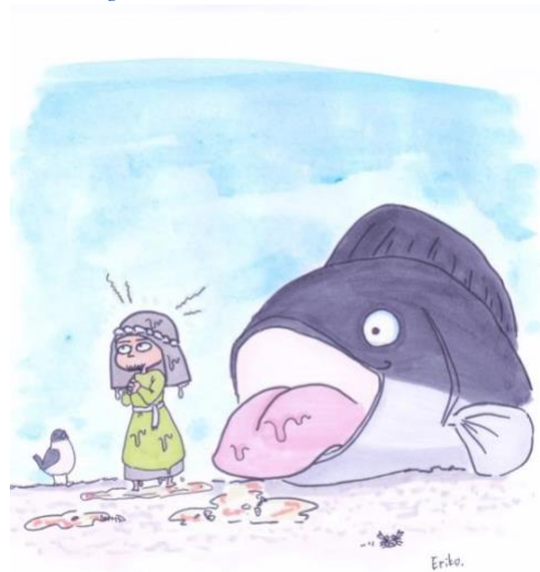
Figure 5 大魚から吐き出されたヨナ