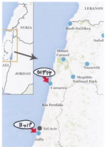
Figure 10 ヨッパとカイザリヤの位置関係

そこで、皆さんに知っていて欲しいのは、私の知る限り、今、私の前に座っておられる皆さんのほとんどは、そっちのグループに入るでしょう。ペテロは「きよくない」と見ていました。皆さんはピチピチ跳ねるエビですよ！（笑）皆さんは凶暴で…ヌルヌルした…気持ち悪い…私はただ、当時のユダヤ人がどういうイメージで見ていたのかを説明しようとしているのです。皆さんのことを考える時ですよ？ユダヤ人は、異邦人の家には、足を踏み入れませんでした。