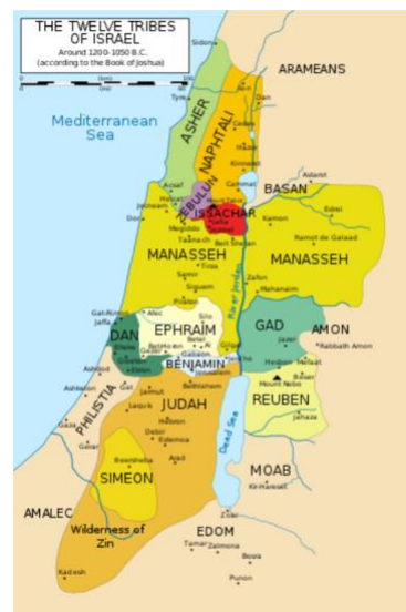
Figure 4 ダン族の割り当て地 (深緑色の所)

彼らは、自分たちの住んでいた領土を変えました。彼らは、神が彼らに与えたものを、人間が選んだものと交換しました。このように、ダンは神に従わず、神が彼らにお与えになった領土を捨てて北へ移動し、イスラエル国境の最北へ行きました。彼らは、安心して安全、肥沃で青々とした場所を見つけたと思ったのです。彼らは、イスラエルの滅びが襲う時、そこがまず先に破壊される場所であることを理解していませんでした。当時、安心安全で肥沃で青々として、素晴らしく平和に見えたことが結局、彼らに滅びをもたらす道、原因となりました。以上が、間違った領土へと移動した、ダン族の神への不従順に関してです。確かに、一方にペリシテ人がいて、他方にはユダ族がいると言う場所では、神が守ってくださるということを信頼しなければならなかったでしょう。これこそ、神を信頼しなければならない状況です。