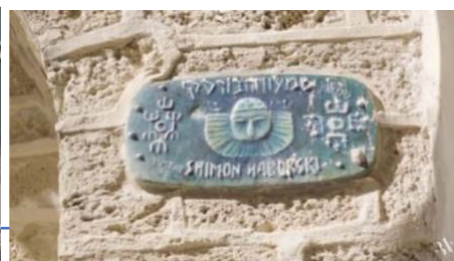
Figure 6 シモンの家の素材