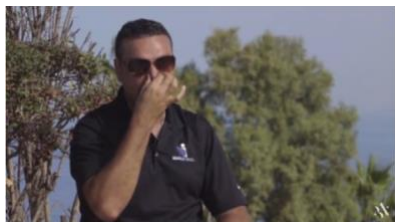
Figure 11 こんな風に！

「コルネリオ。わたしはあなたの言葉を聞いた。わたしは、あなたの祈りと施しを見ている。わたしは、あなたの心を知っている。さあ今、ヨッパに人をやって、シモンという人を招きなさい。彼の名はペテロと呼ばれています。この人は、皮なめしのシモンという人の家に泊まっていますが、その家は海辺にあります。彼があなたに福音を伝えます。」