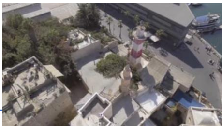
Figure 7 上から撮影