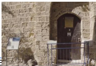
Figure 8 皮なめしのシモンの家