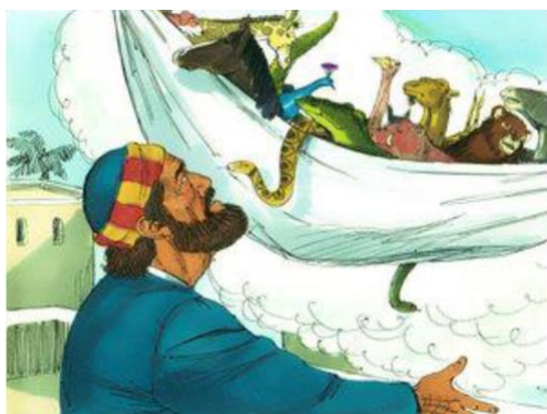
Figure 9 ペテロが見た幻

私はペテロが大好きです。私たちの多くが、彼とよく似ていますから！初め、私たちは信じません。そして、信じないで行動します。それから、私たちは信じると、次は、神よりも聖になります。神が何を求めておられるか、私たちは知っている！だから、神が間違っている時は、我々が神を正すのだ！（笑）