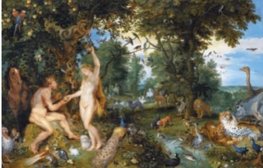
Figure 3 ルーベンス画「楽園のアダムとイブ」

同時に、ある二人の人物について。彼らは、ガリラヤ出身でありながら、最終的には様々な理由があつて、ここに到着しました。ということで、今日は部族について、それから、ガリラヤ出身でありながら、最終的にはこの地に到着した、旧約、新約の二人の人物についてお話します。これから話す部族とは、ダン族のこと。そして、人物とは、預言者ヨナと、ガリラヤ出身の漁師シモン・ペテロです。