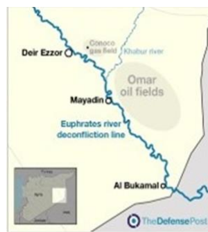
シリア-イラク国境の危険地帯

しかし皆さん、すべてが起こった場所、実際のホットゾーンを見てください。シリアの東部からずっと、拡大しました。グレーのイラクと、ベージュのシリアとの境界があつて、ユーフラテス川がそこを流れています。オマール油田と、コノコガスタ田は、アメリカとクルド人の