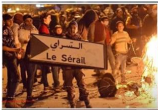
毎晩繰り広げられる レバノンの暴動

します。もう一つの主な理由は、イラクはイランの電力供給に頼っていて、——イランは、イラクの電力を販売しています。そして、イラン国内すべての電力需要が高く、電力不足のために、イラン国民の反乱が起こることを恐れて、イランは、イラクに送電している電力を、たったの200メガワットに削減しました。イラクには、ほとんど何も残っていません。バグダッドの国際空港で電気がないのは、彼らがクウェートに侵攻した戦争（書記注：1990年8月）以来、初めてです。前代未聞です。イラク人は、どうして良いかさえ分かりません。電気はなく、水もなく、絶望的で、彼らは通りに出て、暴動を始めています。どうしたら良いのか、分からないからです。彼らは本当に途方に暮れ、イラク人は今、大いに苦しんでいます。日陰で50℃、日陰ではなく炎天下では60℃。人間が耐えられる気温ではありません。しかし今、苦しんでいる国は、イラクだけではありません。シリアでもまた、電力が低下し、イラクほど悪くありませんが、シリアの人々は、何時間も暗やみの中にいます。そして、電気がない暑い日には、冷蔵庫が、何か他のものとして使われています。これは、シリアの人が投稿した写真です。ご覧の通り、彼は冷蔵庫を靴箱として使っています。明らかに、この冷蔵庫が機能するための電力がありませんから。ところで、イラクの人たちが、赤ちゃんを冷蔵庫に入れている写真を見ました。そっちの方が、まだ少し涼しいからです。彼らは文字通り、冷蔵庫に赤ちゃんを入れているのです。信じられません！しかし現在、電力不足に最も苦しんでいる国は、文字通り、私たちの目の前で崩壊している国、レバノンです。そして、レバノン国民は毎晩外に出て、——外は完全な暗やみなので、彼らは外に出て、ただ暴動を起こし、通りに群がっています。ほら、これがレバノンです。そしてレバノンは今、多くの異なる従属国の国になりつつあります。シーア派のイスラム教徒、スンニ派のイスラム教徒、キリスト教徒、ドゥルーズ、それから、他の一族。誰もが今、自分たちのことで精いっぱい、中央政権がないこと、軍隊は何もできないことを、皆が理解しています。あちらのザレ市では、実際に軍隊が街から追い出されてしまいました。「出て行け！お前たちは何もせず、役立たずだ！」ヒズボラに対する怒りと鬱憤が炎上しています。彼らが、その状況をもたらしたからです。燃料もガソリンもなく、信じられないかも知れませんが、人々はロバを使っています。燃料不足のため、ロバの値段が高騰しました。そして今度は電力不足で、絶望的です。文字通り、私たちの周りの国々は…ほら、私はこの美しいオフィスに座っていて、ここにはエアコンがあって、水道からは水が出てきます。私はこの蛇口から出て来る、一滴一滴に感謝します。ここから約50~80km離れた国々では、それがありませんから。これは本当に心が痛みます。後ほど、それについてお話しします。