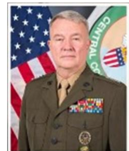
マッケンジー将軍

「これは、我々には対処できないものだ。なぜなら、これらの小さな構成要素は、リーダーの下を飛行し、奇襲するからだ。ロケットなら大丈夫、飛行機でも大丈夫、戦