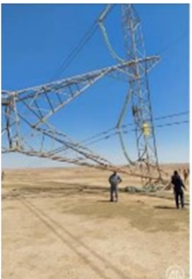
ISISによって倒された