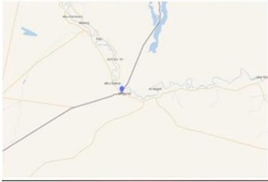
アルカイム国境交差点

手に渡っていて、反対側のディール・アズール、マヤディン、アル・ブカマルは、イラン革命防衛隊によって完全に支配されています。そして、それらのすべてが入る地点は、アルカイム国境交差点です。すぐにご覧いただきます