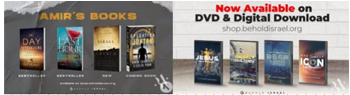
Behold Israel のウェブサイトでお買い求めいただけます。

最後に、皆さんにお知らせです。この先、2ヶ月ほどの間、このオフィスから中東アップデートが行えません。7月と8月の、この過酷な講演ツアーをご覧ください。9月は言及もしていません。ワシントン、アイダホ州、カリフォルニア州、コロラド州、ニューメキシコ州、アリゾナ州、ネバダ州、フロリダ州を訪れます。これは7月と8月で、その後、カリフォルニア、テキサス州、バージニア州に戻って講演します。ですから、皆さんお祈りください。移動が守られるように、また、私の睡眠のためにも。残念ながら、あまりよく眠れなくて…。また、私のチームのためにもお祈りください。ご視聴いただき、