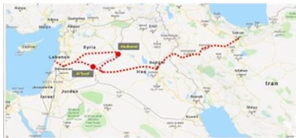
イランから、イラク、シリアを経由して、レバノンに至る陸橋を造る計画

では、米国の攻撃に戻りましょう。なぜなら、民兵に対する米国の攻撃が起こった場所は…しかし、起こったこととその理由を話す前に、イランの“メガ・プラン”をご説明しましょう。イランのメガ・プランは、イラン