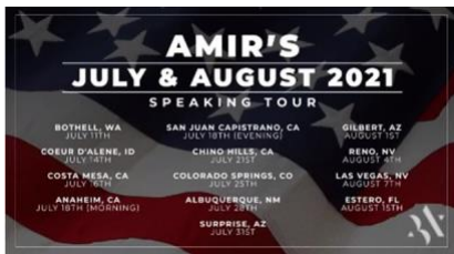
2021年7月8月のアメリカ講演ツアースケジュール

ヴェイシエメラハー וְשִׁמְרוּךָ ..(主が)あなたを守られますように アドナ－イ יְהוָה 主が イェヴァ－レフハー יְבָרְכֶךָ あなたを祝福し ヴィ－フネッカー וַיְהַנֵּךְ ..(主が)あなたを恵まれますように エ－レーハー אֵלֶיךָ あなたに(向けて) パ－ナーヴ פָּנָיו 御顔を アドナ－イ יְהוָה 主が ヤ－エール יֵאָר 照らし シャ－ローム שְׁלוֹם 平安を レハー לְךָ あなたに ヴェヤ－セーム וַיִּשֶׂם (主が)賜るように エ－レーハー אֵלֶיךָ あなたに(向けて) パ－ナーヴ פָּנָיו 御顔を アドナ－イ יְהוָה 主が イッサー יִשָּׂא 上げて