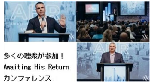
多くの聴衆が参加！ Awaiting His Return カンファレンス