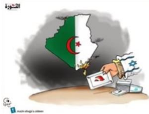
イスラエルのせいにして アルジェリアの火災

[アミール] さて、間違いなく、イエスは気候問題と自然災害について、語られました。中東の他の地域で、何が起きているか、見てください。地中海の他の地域では、イタリアや、ギリシャ、トルコ、アルジェリアなどで火災が起きている。実際アルジェリアでは、当局が、自分達から批判をそらすために、漫画家を雇って、