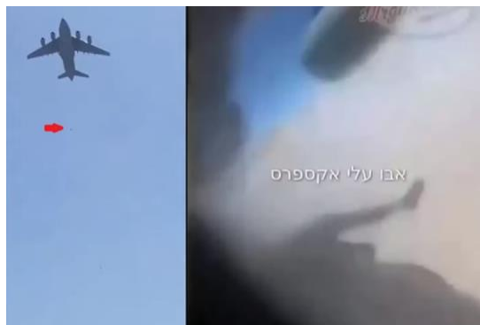
飛行機から人が落ちている(左:赤い矢印の所) その飛行機の内部から取った動画(右)

それについては、すぐにお話ししますが、ここから、私たちの地域でロシアに起こっている話に入ります。さて、アフガニスタンのカブールでの恐ろしい場面を、皆さんにご覧いただきます。皆さん、この飛行中のC17を見てください。人が、実際に落ちているのです。実際、数人が、その飛行機から落ちています。なぜなら、彼らは、その飛行機の車輪につかまっていたからです。上空を飛行中のC17の、このビデオを見てください。人が落ちているのが見えるでしょう。見てください。人が落ちて行きます。皆さんにも見えた事を願います。もう一つの衝撃的な動画は、その飛行機からです。文字通り、飛んでいる人が見えます。見えるでしょうか。見えると良い