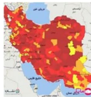
デルタ株が感染爆発するイラン

[アミール] 彼らの自国民の扱いは、本当に残念ですが、それは、世界中で見られます。だからこそ、政府に対する信頼は最低レベルなのです。そして人々は、この世の新しいタイプの指導者を呼び求めるでしょう。私が思うに、反キリストは、その何か違うものへの切望に収まるのでしょうか。