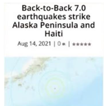
アラスカとハイチで M7.0 !

そして彼らは、過去の彼ら指導者達が下した間違った決断の報いを受けています。同様に、それ以前にも、多くの文明が奪われました。