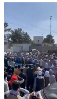
バリケードを超えようと している国民

さて、間違えてはいけません。バージョン 2.0 のタリバンは、より優しく、より寛容に見せかけ、彼らは、すでにいくつかの声明を発表しました。「女性にとっては、前回、タリバンがそこにいた時よりも、楽になる。」しかし、皆さんに言うておきますが、現実には、私の所に届いている報告では、12歳の女の子が、ジハード主義者を、満足させる道具として連れて行かれ、女性はレイプされ、殺され、鞭打たれています。それで足りないなら、協力していた人は、ほぼすべて、政府や、アフガニスタンの軍隊の元で働いていた人すべてが、現在、集められ、処刑されています。現在、大量虐殺が起こっています。そして、信じられないかもしれませんが、私が間違っていなければ、アフガニスタンは現在、人権理事会に参加しています。本当に哀れです。私には、想像もできません。