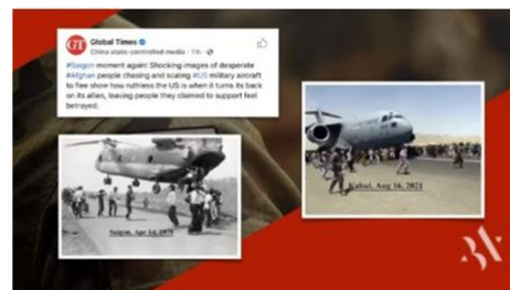
1975年のサイゴン(ベトナム)と 2021年のカブール

中国。まもなく、皆さんは、中国が、台湾、フィリピン、その他の場所、その後、別の島々を乗っ取ったと耳にするでしょう。皆さん、よく聞いてください。アメリカが、世界の超大国である時代は終わりました。ところで、イスラエルは、それを知っています。