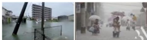
広範囲にわたる日本の洪水