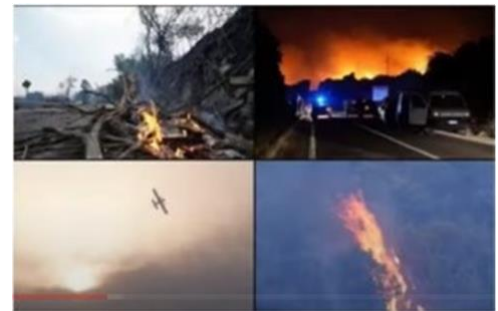
イタリアでの大火災