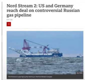
米国とドイツ、論争的となっている ロシアのガスパイプラインに関する 合意に達する

第45代大統領は、それを停止しました。彼は、こう言ったのです。「どうして、NATOの一員が…」彼はドイツに言いました。「北大西洋条約機構(NATO)の一員として、ロシアに対して立ち向かいながら、どうして、彼らのガスのすべてを購入して、彼らの経済を助けるなんて事が出来るのか？そして、資源に頼るとは。そんな事は、してはならない！」