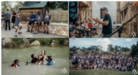
多くの若者たちの信仰を励ました ヤング・アダルト・リトリート

[マイク] はい。イスラエルツアーが行えなかったのです。私たちは通常、夏に、若者たちと実際にイスラエルで行っているのですが、今年は、多くの若者たちを、テキサス州にあるリトリートセンターに連れて行きました。そして、私たちのスタッフと、これらの若者たち全員が…皆さん、約 70 人が参加しました。私たちはずっと、このことについて話してきて、皆さんは、ずっと祈って下さり、多くのご支援をいただいたおかげで、私たちは、若者たちの多くに、奨学金を出す事ができました。皆さん、先週のこのリトリートで、12 人が洗礼